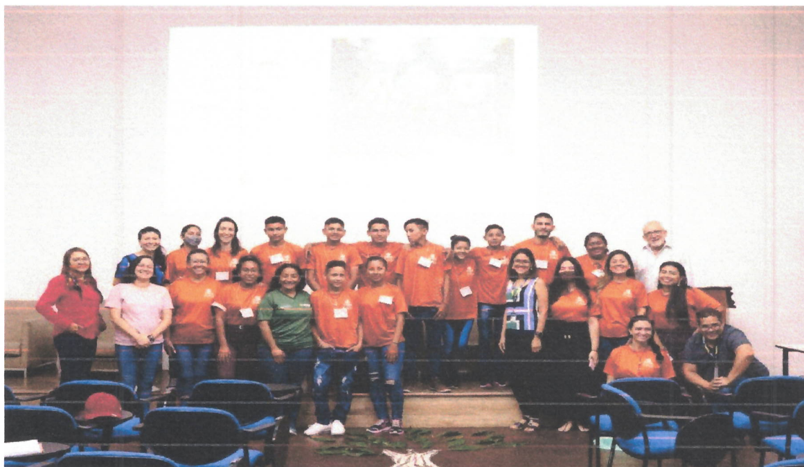
Figura 7. II Seminário Técnico de Práticas Agroecológicas com alunos e professores da Escola Estadual Yamamay/ NIEDS Núcleo Uatumã na sede da FAS (09/06/2022).