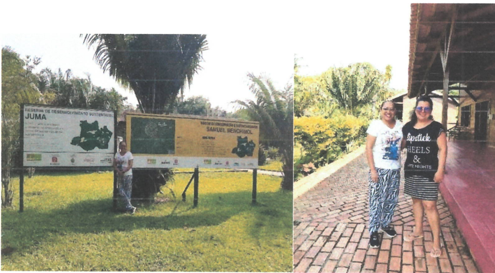
Fig: 12 – Imagem da comunidade Boa frente e gestora da E.E. J.W. Marriot Jr.