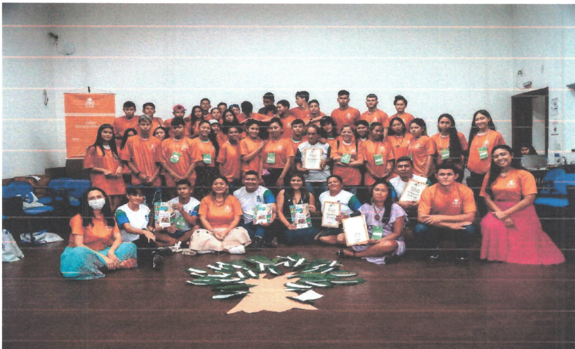
Figura 12. III Seminário Técnico de Soluções Inovadoras: Jovens Líderes na Educação Ribeirinha, com a participação de 23 alunos das escolas dos NIEDS Uatumã, Márcio Ayres e Samuel Benchimol, realizado na sede da Fundação Amazônia Sustentável, Manaus/AM. (01/09/2022).