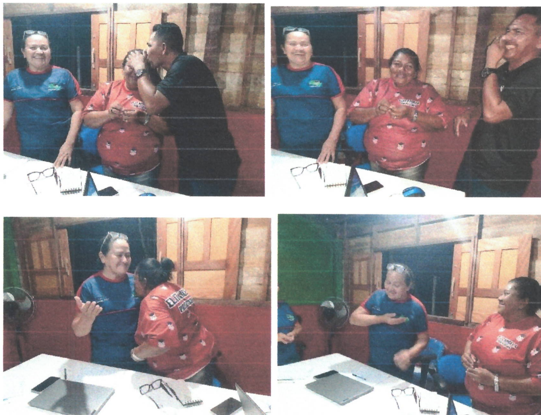
Fig.02 – Dinâmica da “Formiguinha”

participantes beijem o lugar onde colocaram a formiguinha. Sendo assim, todos se sentem mais próximos e o clima de descontração é visto entre as pessoas.