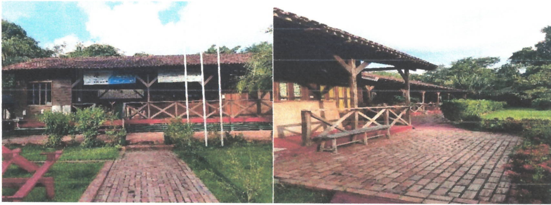
Fig: 11 – Imagem da E.E. J.W. Marriot Jr e alojamento dos alunos.