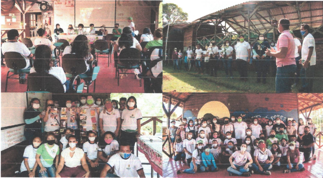
Figuras 1,2,3,4. Evento de lançamento do projeto de Formação e Educação de Populações Ribeirinhas no Amazonas – Melhoria do Ensino Complementar e Relevante aos Estudantes Ribeirinhos do Ensino Médio e Fundamental no Núcleo de Inovação e Educação para a Sustentabilidade (NIEDS) da comunidade Tumbira, RDS do Rio Negro, Iranduba/AM (26/11/2021).