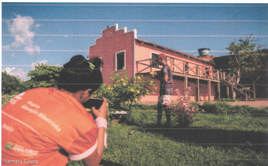
Figura 10. Oficina de Educomunicação com alunos da Escola Estadual Profª Cinthia Regia do Livramento do NIEDS Márcio Ayres na comunidade Punã, RDS Mamirauá, Itapiranga/AM (20/09/2022).