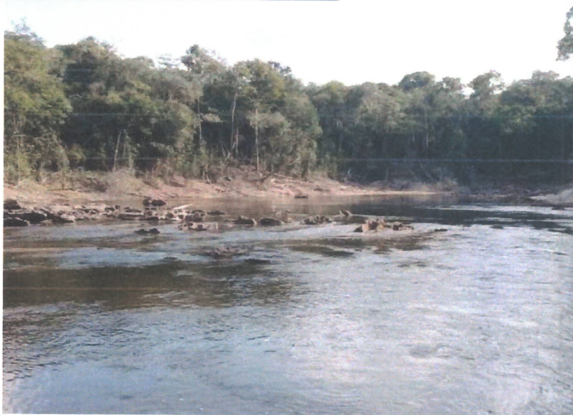
Fig. 14 – Rio Mariepauá.