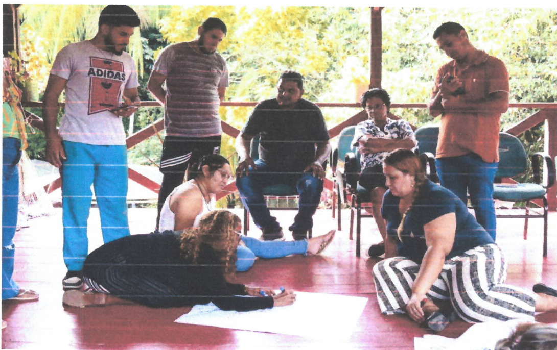
Figura 14. Oficina pedagógica com 25 professores das escolas atendidas pelo projeto para a definição conjunta do conteúdo do Caderno de Boas Práticas Pedagógicas de Leitura na comunidade Tumbira, RDS do Rio Negro (13/04/2023).