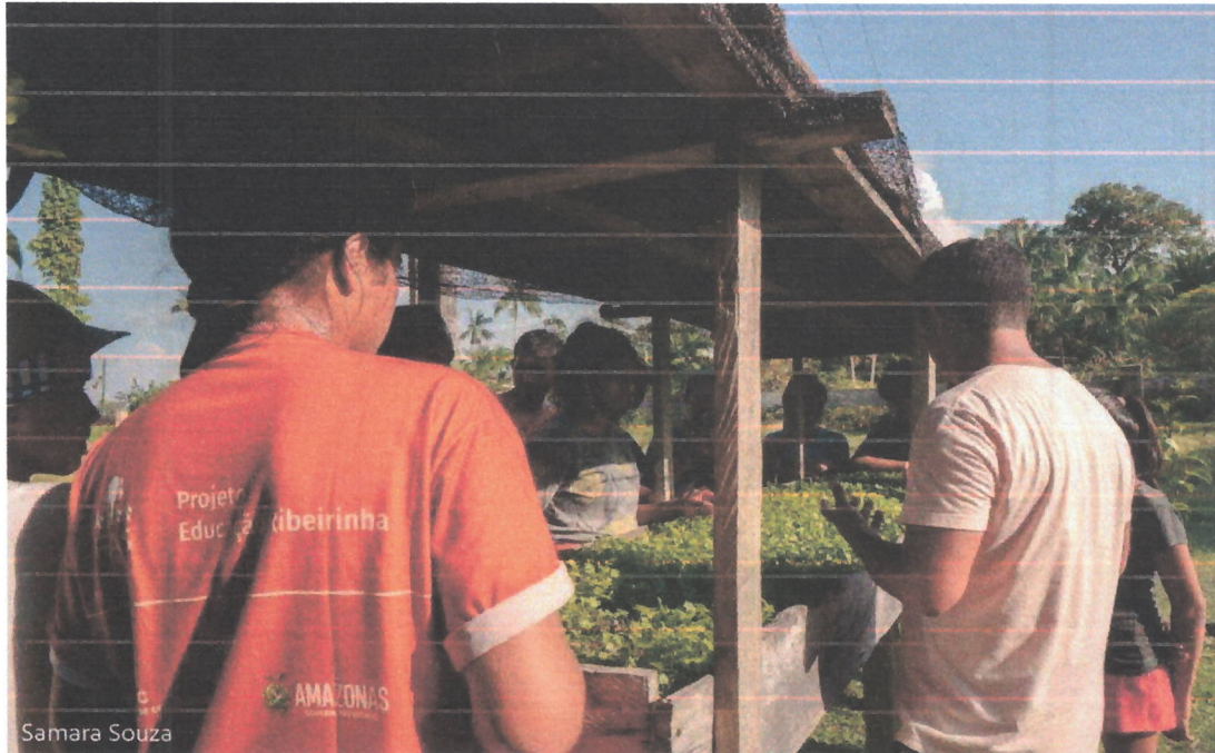
Figura 11. Oficina de Práticas Agroecológicas com com alunos da Escola Estadual Profª Cinthia Regia do Livramento do NIEDS Márcio Ayres na comunidade Punã, RDS Mamirauá, Itapiranga/AM (21/09/2022).