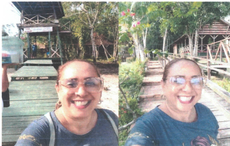
Fig: 10 – Imagem da frente do NIEDS Assy Manana