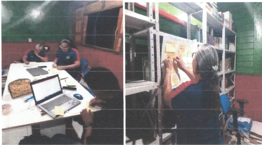
Fig.03 – Momento de elaboração do painel tempestade de ideias.

Após a elaboração das palavras ou frases, os participantes deveriam colocar suas ideias no painel e verificar uma ligação com o tema gerador “PPP” e explicar para os demais participantes o porquê da escolha de cada frase ou palavra. A partir dessa ação, foram explicados sobre a importância do PPP.