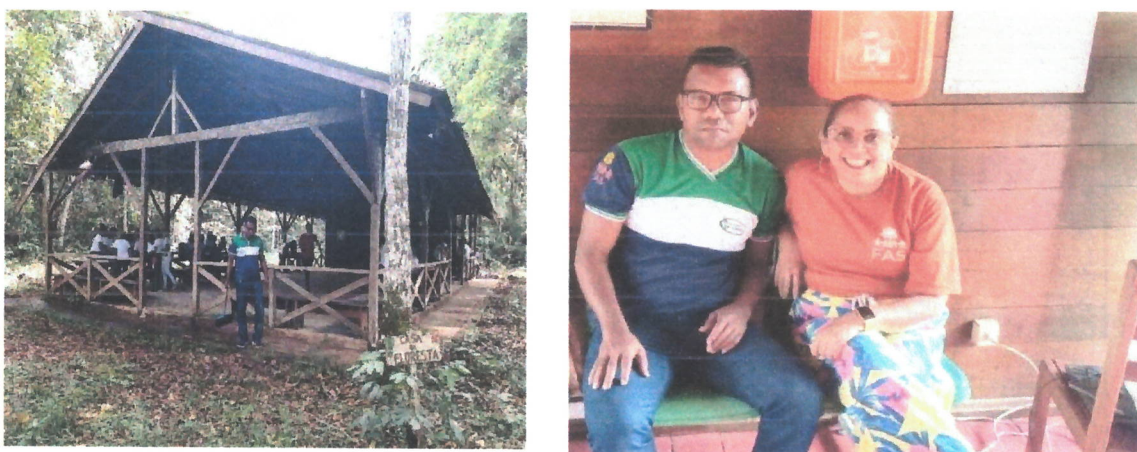
Fig: 13 – atividades na casa da floresta com alunos e professores