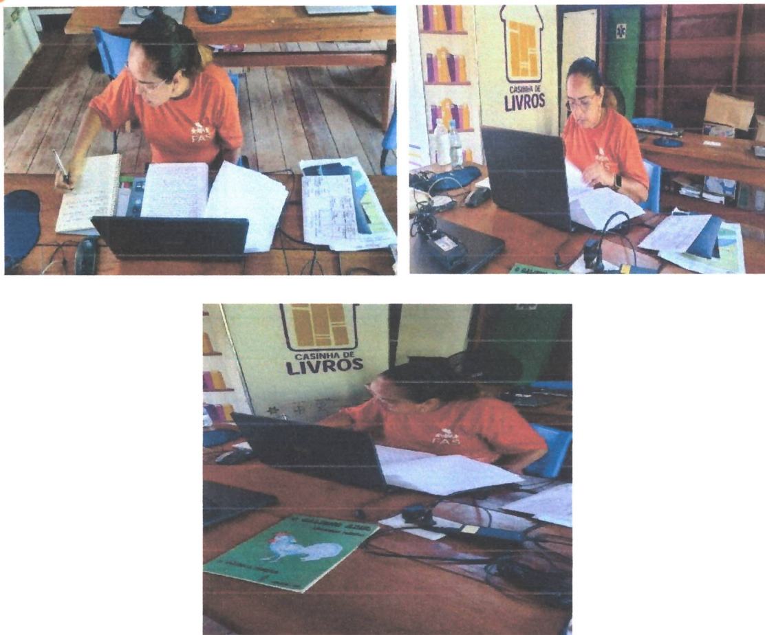
Fig. 07, 08, 09 – Leitura e análise do PPP da E.E. Thomas Eugene Lovejoy

NIEDS Assy Manana – Comunidade Três Unidos – APA Rio Negro. Escola Estadual Samsung do Amazonas