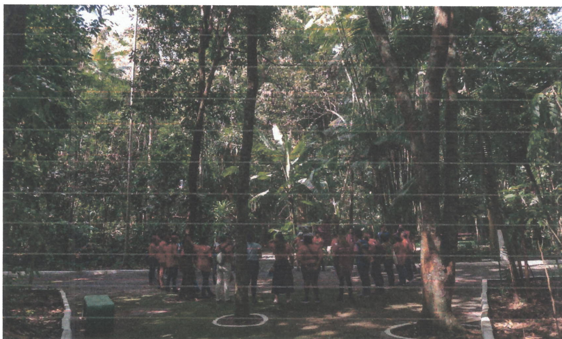
Figura 8. Visita guiada ao Bosque da Ciência do Instituto Nacional de Pesquisas da Amazônia (INPA) em Manaus com alunos da Escola Estadual Yamamay/ NIEDS Uatumã como atividade do intercâmbio do projeto (09/06/2022).