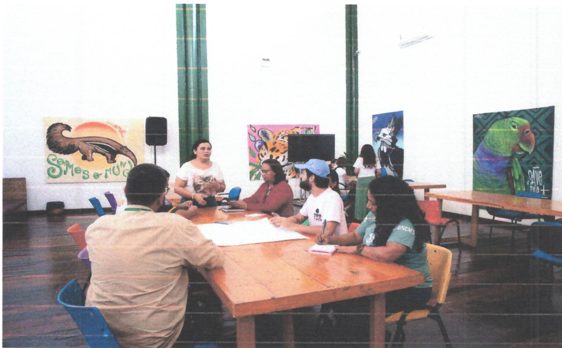
Figura 6. Formação dos grupos de trabalho para discutirem a temática de educação relevante na Amazônia, seus desafios e soluções durante o I Seminário Técnico de Soluções Inovadoras na sede da FAS (08/06/2022).