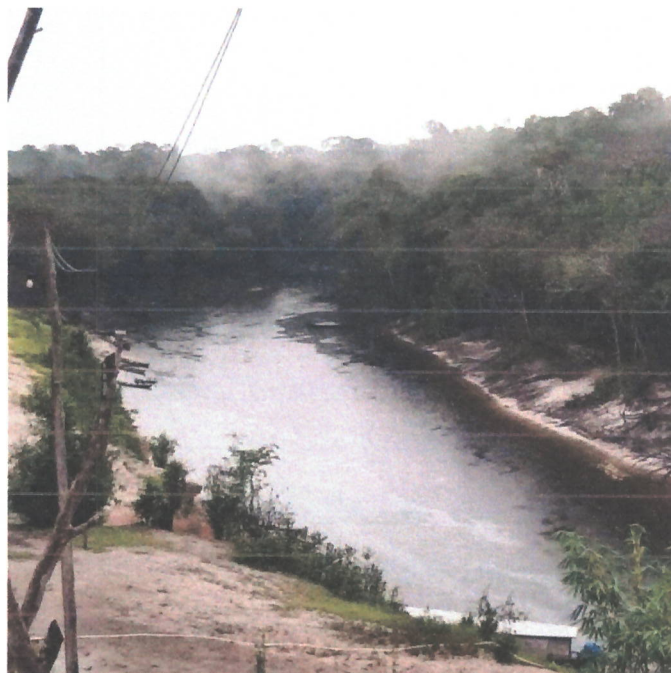
Fig 16: Comunidade Nova Jerusalém.