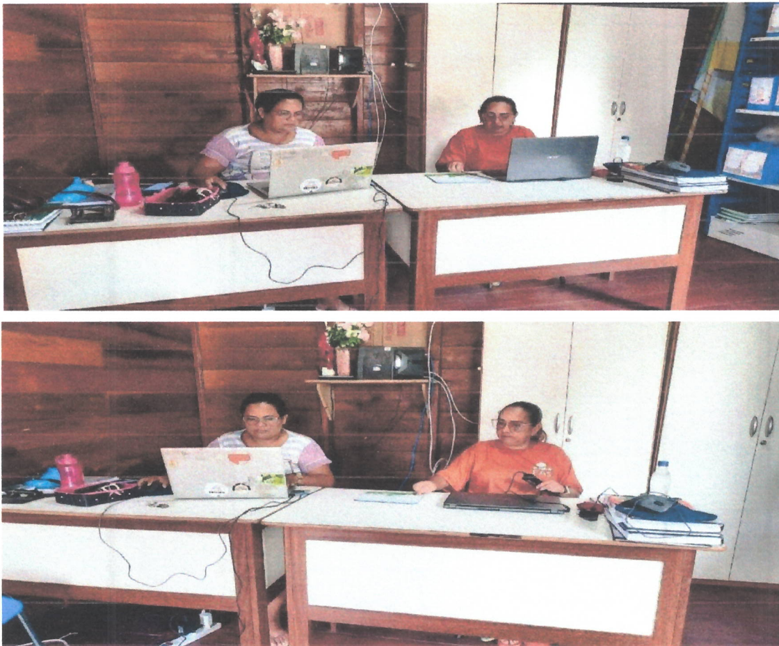
Fig. 05 e 06 – Elaboração do PPP da EE Cinthia Régia

Foi elaborado junto a gestão, os gráficos dos documentos, indicadores educacionais, com os dados de matrícula, índice de aprovação e reprovação escolar, avaliação externas, como SAEB e SADEAM. Inclusive a escola não recebe verba federal como PDDE devido a quantidade de alunos matriculados.