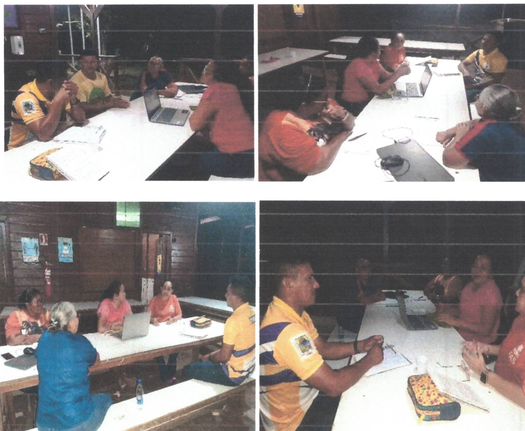
Fig.01 – Reunião de implementação do projeto PPP.

Perguntei da gestora se a E.E. Yamamay já tinha um modelo da estrutura do PPP, a mesma respondeu que não. Me comprometi de levar um modelo para a construção.