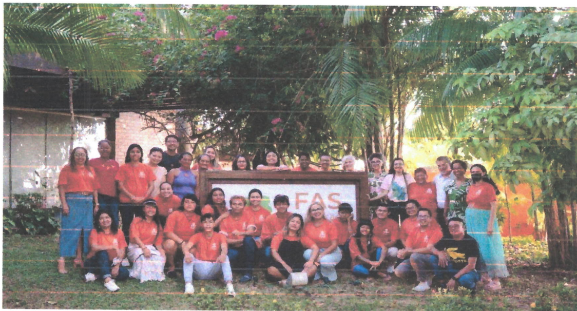
Figura 13. Encontro dos Educadores da Floresta para o compartilhamento dos resultados dos projetos pedagógicos durante o evento do Centenário Darcy Ribeiro na sede da Fundação Amazônia Sustentável, Manaus/AM (08/11/2022).